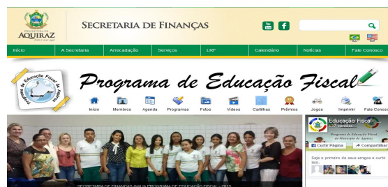
Figura - Demonstração do site da Secretaria de Finanças de Aquiraz